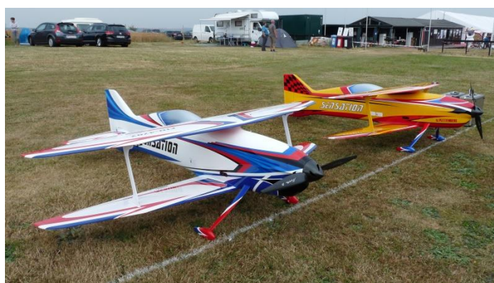
Both planes ready for the EC 2018

always we have something in our mind and new things to try and that makes this hobby interesting.